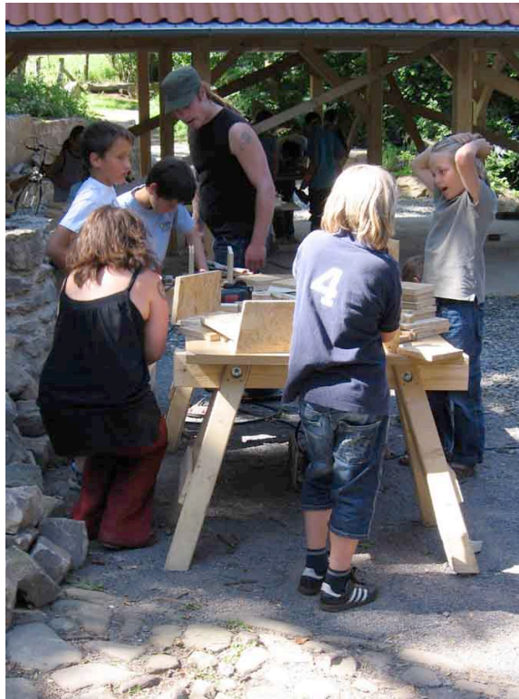
Bau von Nistkästen am Rolfschen Hof